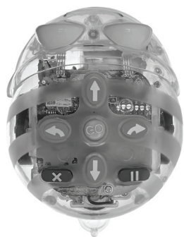
USB nabíjecí slot